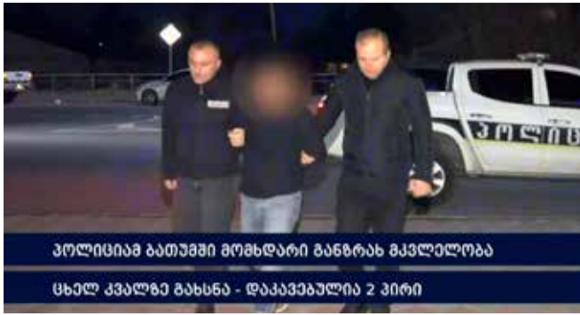
პოლიცია ბათუმში მომხდარი განზრახ მკვლელობა ცხელ კვალზე გახსნა - დააკავეს ორი პირი

შინაგან საქმე სამინისტროს აჭარის პოლიციისა და შიდა ქართლის პოლიციის დეპარტამენტების თანამშრომლებმა, ცხელ კვალზე, ერთობლივად ჩატარებული ოპერატიული-სამძებრო ღონისძიებებისა და საგამოძიებო მოქმედებების შედეგად, დამამძიმებელ გარემოებაში, ორი ან მეტი პირის მიმართ ჯგუფურად ჩადენილი განზრახ მკვლელობის ბრალდებით უცხო ქვეყნის ორი მოქალაქე დააკავეს.