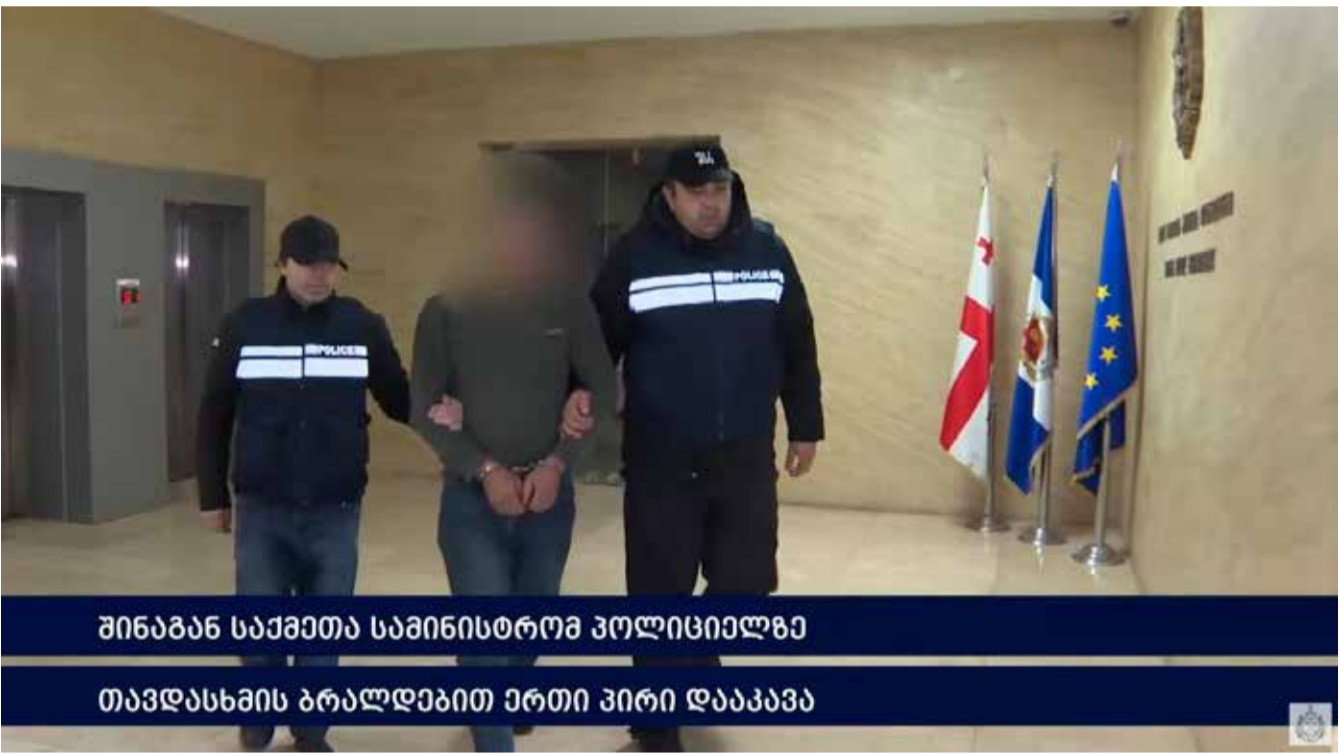
შინაგან საქმეთა სამინისტროს პოლიციელმა თავდასხმის ბრალდებით ერთი პირი დააკავეს

შინაგან საქმეთა სამინისტროს თბილისის პოლიციის დეპარტამენტის თანამშრომლებმა, ჩატარებული ოპერატიული ღონისძიებებისა და საგამოძიებო მოქმედებების შედეგად, პოლიციაზე თავდასხმის ბრალდებით, 1972 წელს დაბადებული დ.ლ. დააკავეს.