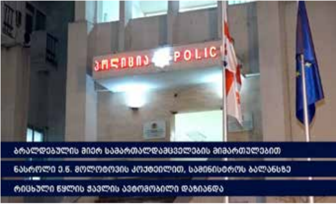
ბრალდებულის მიერ საპარტოლ-დაცველობის მიმართულია ნასროლი ა.მ. მოლოტოვის კოქტეილით, სამინისტროს ბალანსზე რისხული წყლის ვაჟის ავტომობილი დაზიანდა