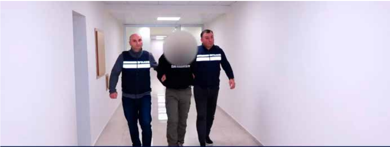
შინაგან საქმეთა სამინისტრომ