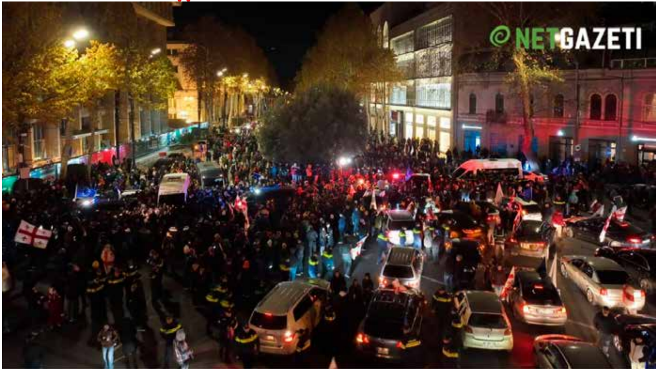
„წინ განუჭვრეტელი სიბნელეა... ზეგ გეტყვით გეგმას არა, იხვი“

„ელემენტარული თვლა მაინც იცის ამ ამომრჩეველმა და ძალიან კარგად თვლის იმას, რომ ოთხივე პარტიის შეთანხმებული მოქმედების გარეშე, მათი ხმების გარეშე, ვერ შედგებოდა კოალიციური მთავრობა. და დღეს, როცა ეს პარტიები, ერთი კადრი მაჩვენებთ ერთად დგომის, როცა იმას ვერ ახერხებენ, რომ საკუთარი ამომრჩევლის ნება და ხმები დაიცვან ამ ერთი თვის მანძილზე და ერთად ვერ დადგნენ, რომელი კოალიციური მთავრობის ფორმირებაზე მელაპარაკებოდნენ ესენი, ამიტომაც არ გამოვიდა ამომრჩეველი. სხვა თუ არაფერი, თვლა ხომ ვიცი და ელემენტარულად დათვალა ამომრჩეველმა, რომ ეს ხალხი კოალიციური მთავრობის ფორმირებისთვის მზად არ ყოფილა იმიტომ, რომ მათი ხმების დასაცავად ვერ დადგა და არ დადგა გარეთ. თუ ასე არ ენდობოდნენ ერთმანეთს, მაშინ ვის აყრიდით თვალებში ნაცარს და რომელი კოალიციური მთავრობის ფორმირებას აპირებდით და რის და ვის ხარჯზე აპირებდით...“ ჩემო მეგობრებო, გეკითხებით, 26-ში, სალამოს 9 საათზე, რატომ იდექით გაოგნებული სახეებით, ვინც გაბედეთ და დადექით ეკრანების წინ და დანარჩენები საე-