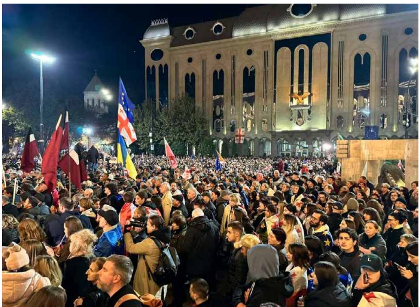
დასასრული მე-4 გვერდზე