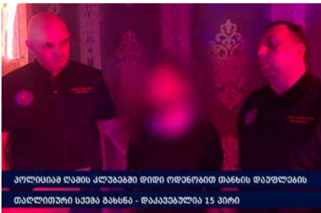
პოლიციამ ღამის კლუბებში დიდი ოდენობით თანხის დაუფლების თაღლითური სქემა გახსნა - დაკავებულია 15 პირი

შინაგან საქმეთა მინისტრის ცენტრალური კრიმინალური პოლიციის დეპარტამენტის ორგანიზებულ დანაშაულთან ბრძოლის მთავარი სამმართველოს ტრეფიკინგისა და უკანონო მიგრაციის წინააღმდეგ ბრძოლის სამმართველოს თანამშრომლებმა, გენერალურ პროკურატურასთან ერთად ჩატარებული ოპერატიული ღონისძიებებისა და საგამოძიებო მოქმედებების შედეგად, მოსამართლის განჩინების საფუძველზე, დიდი ოდენობით თანხის დაუფლების თაღლითური სქემა გახსნეს, დაკავებულია 15 პირი.