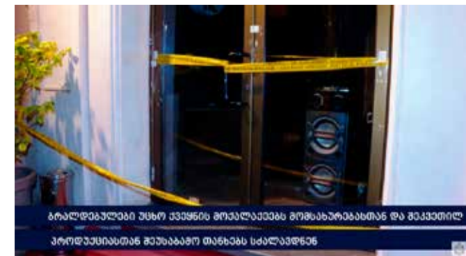
ბრალდებულები უცხო ქვეყნის მოქალაქეებს მომსახურებასთან და შეკვეთილ პროდუქციასთან დაკავშირებით თანხებს სძალავდნენ

იმ შემთხვევაში, თუ სტუმარი უარს აცხადებდა თანხის გადახდაზე, თანამშრომლები მათზე ფსიქოლოგიურ ზეწოლასა და მუქარას ახორციელებდნენ და ამ გზით ცდილობდნენ მოთხოვნილი თანხის მიღებას. ხოლო, თუ დაზარალებულები მაინც უარს აცხადებდნენ თაღლითურად დაკისრებული თანხის გადახდაზე, მათ ფიზიკურად უსწორდებოდნენ. პოლიციამ ჩატარებული საგამოძიებო მოქმედებების შედეგად, დანაშაულის ჩამდენი პირები, მოსამართლის განჩინების საფუძველზე, თბილისში დააკავა. სამართალდამცველების მიერ ნივთმტკიცებად კომპიუტერული ტექნიკა და მობილური ტელეფონებია ამოღებული. გამოძიება საქართველოს სისხლის სამართლის კოდექსის 180-ე და 181-ე მუხლებით მიმდინარეობს.