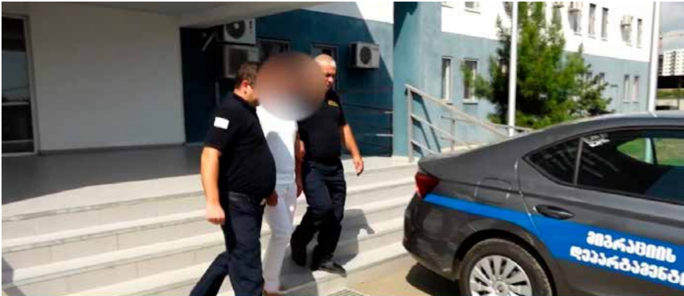
მიგრაციის დეპარტამენტის თანამშრომლებმა მიმდინარე წლის