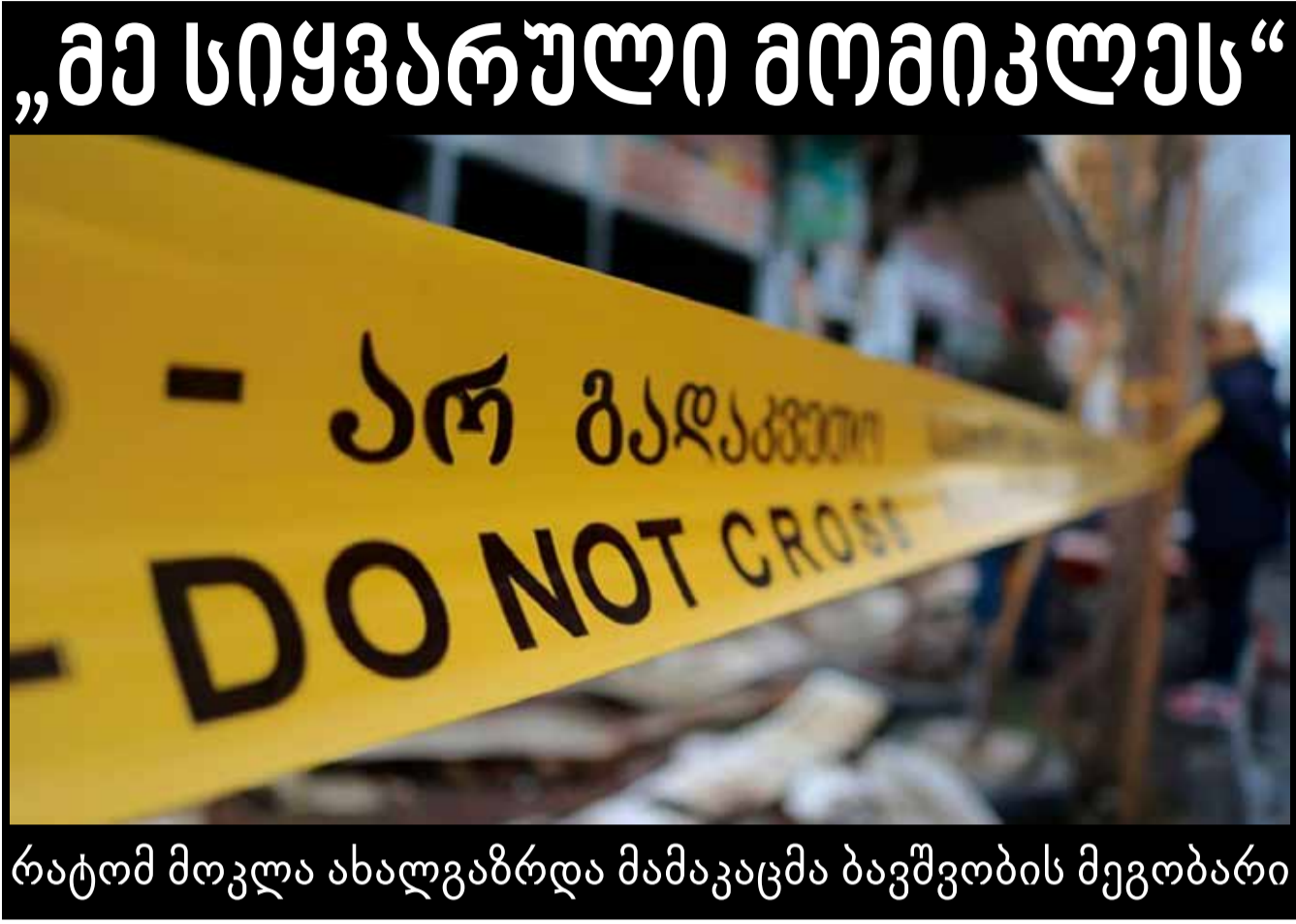
რატომ მოკლა ახალგაზრდა მამაკაცმა ბავშვობის მეგობარი