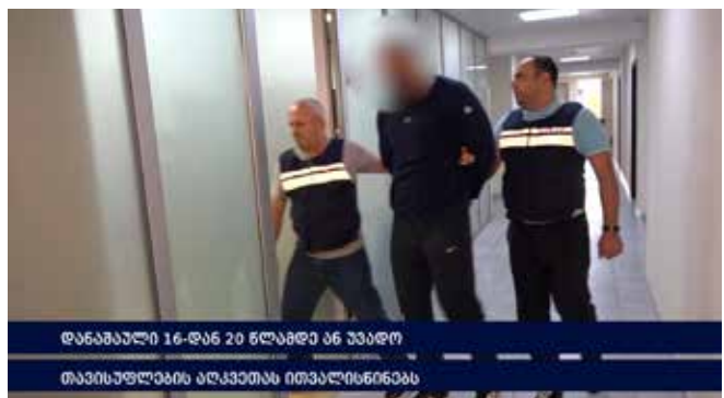
დანაშაული 16-დან 20 წლამდე ან უადრდო თავისუფლების აღკვეთას ითვალისწინებს