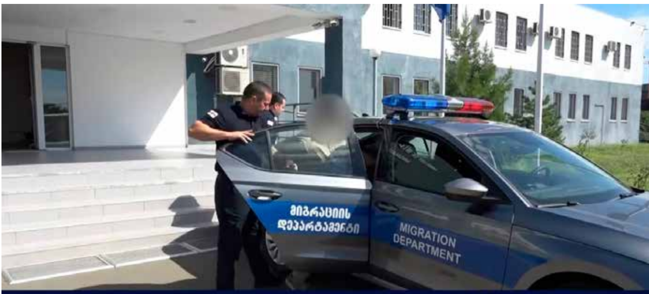
მიგრაციის დეპარტამენტის თანამშრომლებმა მიგინარა წლის აგვისტოს თვეში უცხო ქვეყნის 33 მოქალაქე საქართველოდან გააძევეს

შეხვედრის დასასრულს, მხარეებმა იმედი გამოთქვეს, რომ არსებული ორმხრივი თანამშრომლობა ერთობლივი ძალისხმევით, მომავალში, კიდევ უფრო ინტენსიური გახდება.