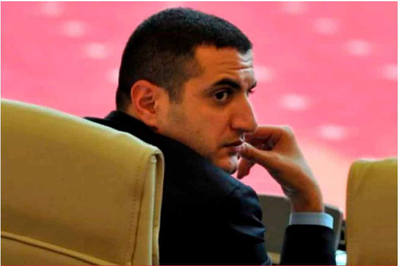
დავით კეზერაშვილის შავ-ბნელი საქმეების ანატომია

2006 წელს, საქართველოში დარეგისტრირდა კომპანია „სოკარ-ჯორჯია“, რომელიც შედგებოდა რამდე-