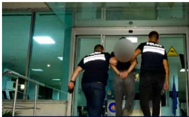
დანაშაული 4-დან 7 წლამდე ვადით თავისუფლების აღკვეთას ითვალისწინებს თავისუფლების აღკვეთის ითვალისწინებას