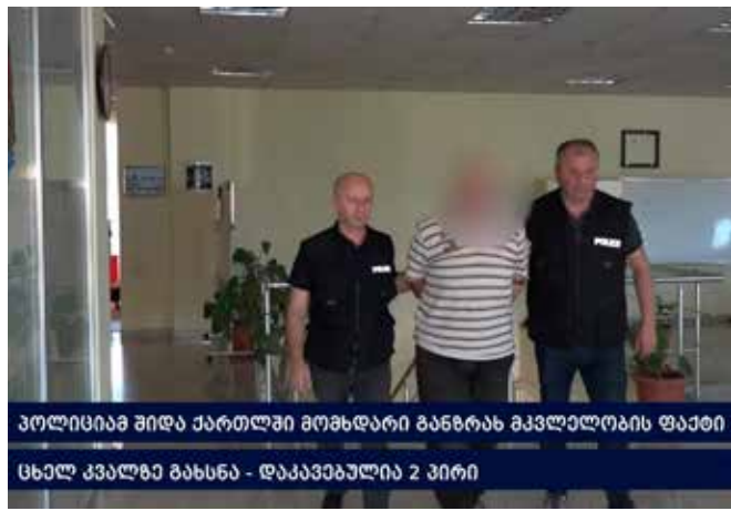
პოლიციამ შიდა ქართლში მომხდარი განზრახ მკვლელობის ფაქტი ცხელ კვალზე გახსნა - დააკავებულა 2 პირი

სამართალდამცველებმა ბრალდებულები ცხელ კვალზე დააკავეს. ფაქტზე გამოძიება სისხლის სამართლის კოდექსის 108-ე და 25-108-ე მუხლებით მიმდინარეობს.