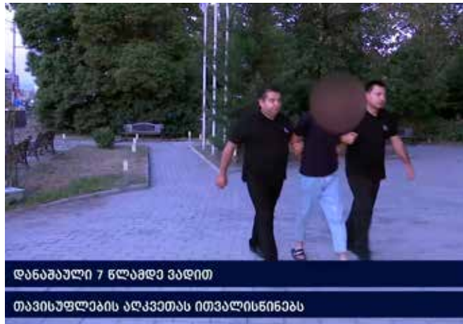
დანაშაული 7 წლამდე ვადით თავისუფლების აღკვეთას ითვალისწინებს

მომხდარ ფაქტებზე გამოძიება საქართველოს სისხლის სამართლის კოდექსის 25 – 181-ე და 187-ე მუხლებით მიმდინარეობს.