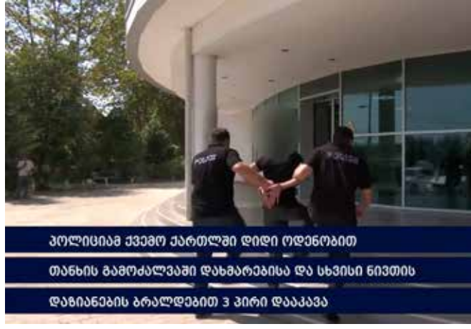
პოლიციამ ქვემო ქართლში დიდი ოდენობით თანხის გამოძალვაში დახმარებისა და სხვისი ნივთის დაზიანების ბრალდებით 3 პირი დააკავა

შინაგან საქმეთა სამინისტროს ქვემო ქართლის პოლიციის დეპარტამენტის მარნეულის რაიონული სამმართველოს თანამშრომლებმა, ჩატარებული ოპერატიულ-სამძებრო ღონისძიებებისა და საგამოძიებო მოქმედებების შედეგად, ჯგუფურად ჩადენილი დიდი ოდენობით თანხის გამოძალვაში დახმარების, ასევე სხვისი ნივთის დაზიანების ფაქტებზე სამი პირი დააკავეს.