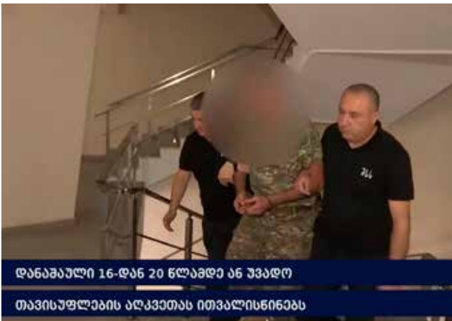
დანაშაული 16-დან 20 წლამდე ან უვადო თავისუფლების აღკვეთას ითვალისწინებს

პოლიციამ დანაშაულის ჩადენის იარაღი ნივთმტკიცებად ამოიღო. გამოძიება საქართველოს სისხლის სამართლის კოდექსის 11 პრიმა 109-ე მუხლით მიმდინარეობს.