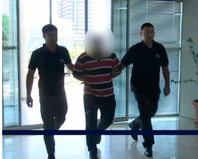
დანაშაული 7 წლამდე ვადით თავისუფლების აღკვეთას ითვალისწინებს.

დაკავებულები არიან: 1990 წელს დაბადებული ნ.ბ., 1993 წელს დაბადებული ტ.ნ. და 1998 წელს დაბადებული რ.ბ.