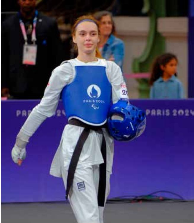
პარიზში მიმდინარე პარაოლიმპიურ თამაშებზე, პირველი ოქროს მედალი მოვიპოვეთ. ზოგადად, პარაოლიმპიადაზე, ქართველ სპორტსმენებს აქამდე