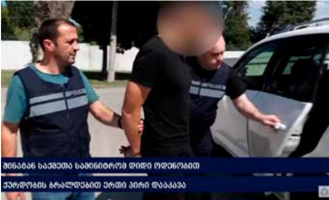
შინაგან საქმეთა სამინისტრომ დიდი ოდენობით ქურდობის ბრალდებით ერთი პირი დააკავა

შინაგან საქმეთა სამინისტროს თბილისის პოლიციის დეპარტამენტის თანამშრომლებმა, ჩატარებული ოპერატიული ღონისძიებებისა და საგამოძიებო მოქმედებების შედეგად, დიდი ოდენობით ქურდობის ბრალდებით, უკრაინის მოქალაქე – 1989 წელს დაბადებული რ.პ. დააკავეს.