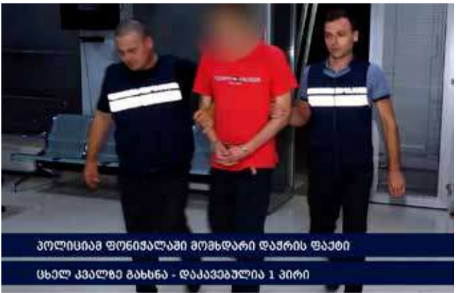
პოლიციამ ფონიჭალაში მომხდარი დაჭრის ფაქტი ცხელ კვალზე გახსნა - დაკავებულია 1 პირი