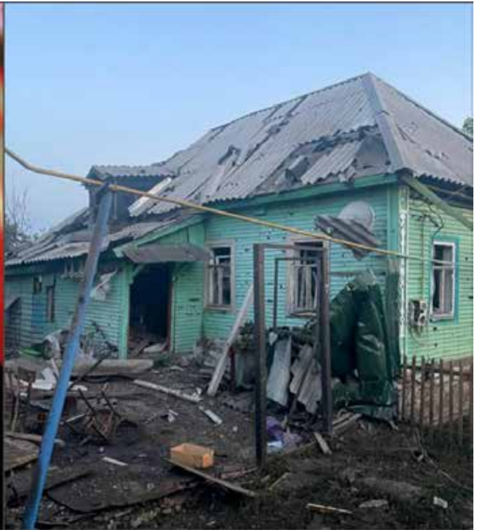
კურსკის ბრძოლების ქრონიკა – როგორ უმტყუნა ნერვებმა ვლადიმერ ვლადიმერის ძეს მთავრობის სხდომაზე

სექტემბერ-ოქტომბრის წვიმებით, შესაბამისად, უკრაინელებს გაუადვილდებათ ამ ტერიტორიების დაცვა. გააჩნია, რამდენის დაცვას გადამწყვეტენ უკრაინელები. არა მგონია, რაც დაიკავეს, მთლიანად იმ ტერიტორიის დაცვა დაიწყონ“, – მიიჩნევს გადამდგარი გენერალი.