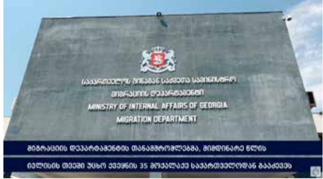
მიგრაციის დეპარტამენტის თანამშრომლებმა, მიმდინარე წლის ივლისის თვეში უცხო ქვეყნის 35 მოქალაქე საქართველოდან გააძევეს

შინაგან საქმეთა სამინისტროს მიგრაციის დეპარტამენტის თანამშრომლებმა, „უცხოელთა და მოქალაქეობის არმქონე პირთა სამართლებრივი მდგომარეობის შესახებ“ საქართველოს კანონის საფუძველზე, გასულ თვეში, სხვადასხვა ქვეყნის 35 მოქალაქე ქვეყნიდან გააძევეს. უცხო ქვეყნის მოქალაქეთა ნაწილმა საქართველო ნებაყოფლობით დატოვა, ნაწილი კი მიგრაციის დეპარტამენტის მიერ ჩატარებული ღონისძიებების შედეგად, იძულების წესით იქნა გაძევებული ქვეყნიდან.