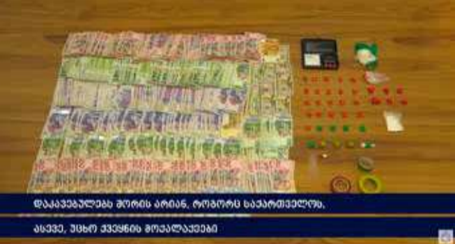
დააკავალა 28 პირი ბრძოლის, როგორც საპატრულოდ.

შინაგან საქმეთა სამინისტროს ცენტრალური კრიმინალური პოლიციის, თბილისის, აჭარის, სამეგრელო-ზემო სვანეთის, კახეთის და იმერეთის დეპარტამენტების თანამშრომლებმა, გენერალურ პროკურატურასთან ერთად, ბოლო პერიოდში ჩატარებული ოპერატიული ღონისძიებებისა და საგამოძიებო მოქმედებების შედეგად, ნარკოდანაშაულის ბრალდებით 28 პირი დააკავეს. დაკავებულთა შორის, 16 ნარკორეალიზატორია.