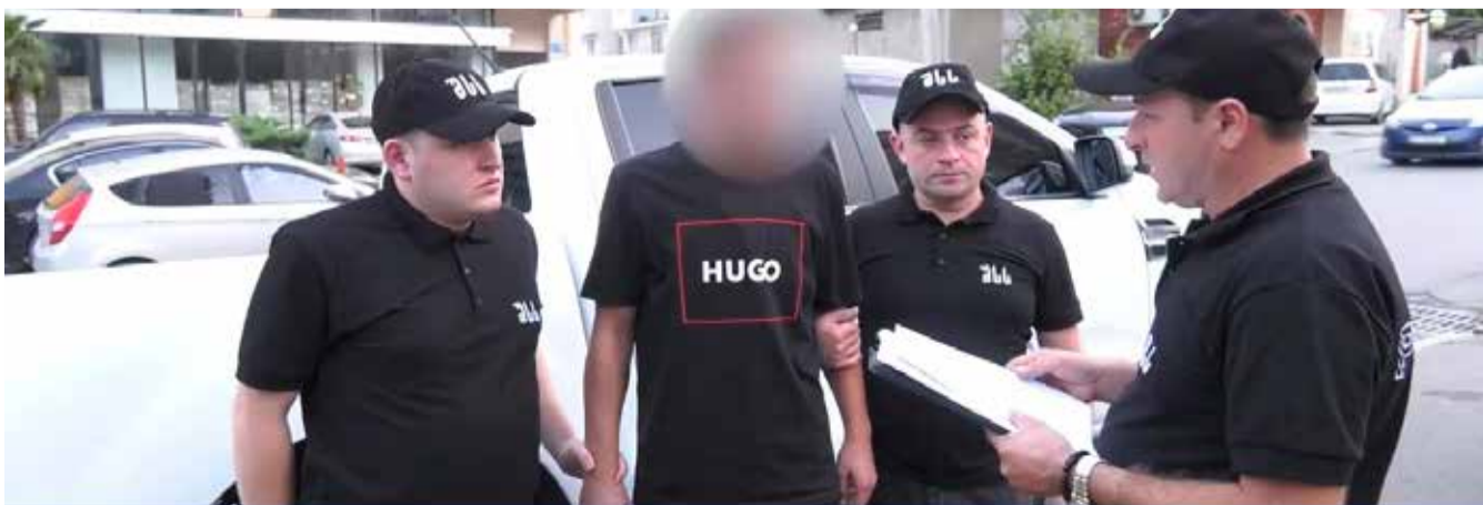
შინაგან საქმეთა სამინისტრომ „ქურდულ სამყაროსთან“

გამოძიება საქართველოს სისხლის სამართლის კოდექსის 223-ე პრიმა მუხლის პირველი ნაწილით და 223-ე ტერცია მუხლის მე-2 ნაწილით მიმდინარეობს.