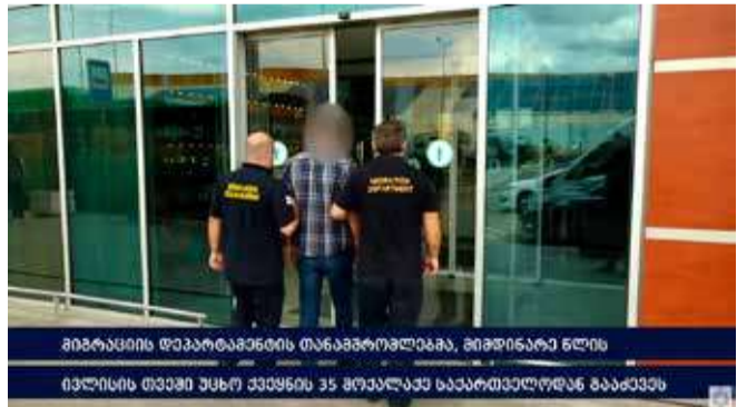
მიგრაციის დეპარტამენტის თანამშრომლებმა, მიმდინარე წლის ივლისის თვეში უცხო ქვეყნის 35 მოქალაქე საქართველოდან გააძევეს

შინაგან საქმეთა სამინისტროს მიგრაციის დეპარტამენტი წარმოადგენს ქვეყნის შიგნით უკანონო მიგრაციის წინააღმდეგ ბრძოლაზე პასუხისმგებელ ორგანოს. მისი ერთ-ერთი კომპეტენცია არის საქართველოში სამართლებრივი საფუძვლის გარეშე მყოფი უცხო ქვეყნის მოქალაქეების გამოვლენა და საქართველოდან გაძევების განხორციელება.