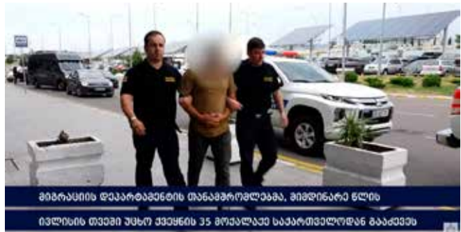
მიგრაციის დეპარტამენტის თანამშრომლებმა, მიმდინარე წლის ივლისის თვეში უცხო ქვეყნის 35 მოქალაქე საქართველოდან გააძევეს