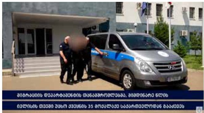
მიგრაციის დეპარტამენტის თანამშრომლებმა, მიმდინარე წლის ივლისის თვეში უცხო ქვეყნის 35 მოქალაქე საქართველოდან გააძევეს