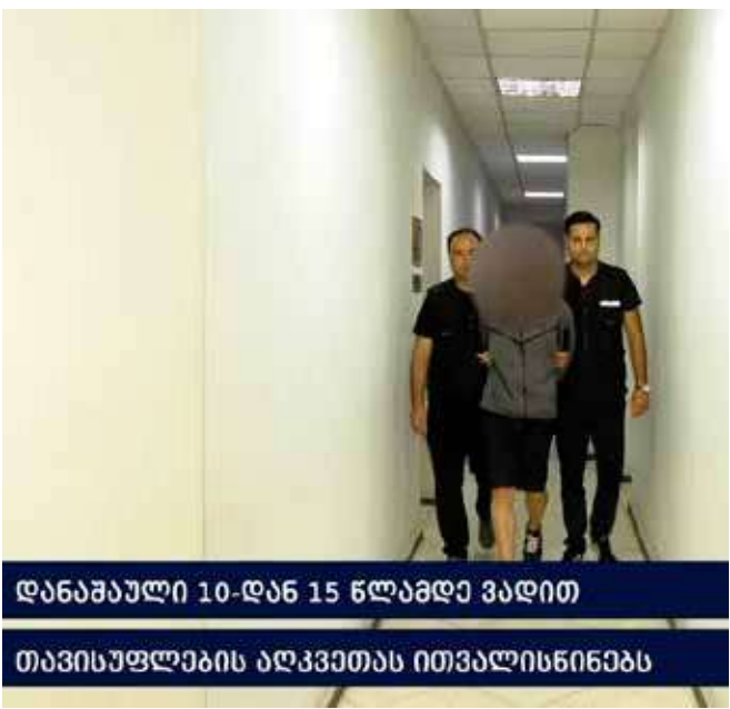
დანაშაული 10-დან 15 წლამდე ვადით

განზრახ მკვლელობის ფაქტზე გამოძიება სისხლის სამართლის კოდექსის 108-ე მუხლით მიმდინარეობს.