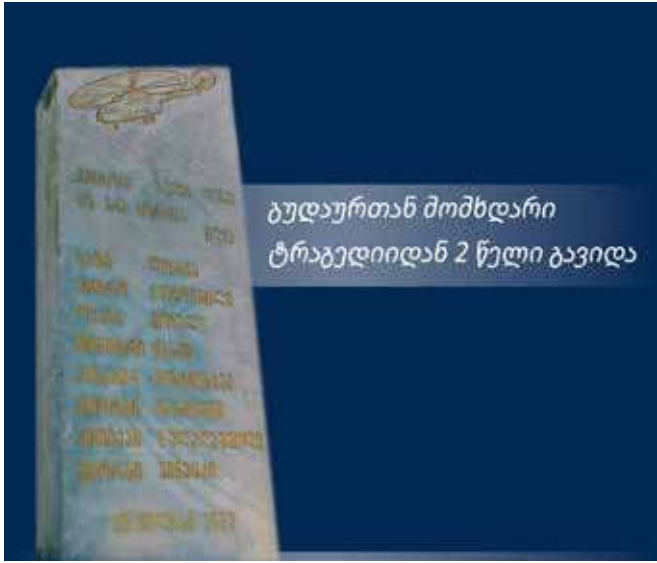
გუდაურთან მომხდარი ტრაგედიიდან 2 წელი გავიდა