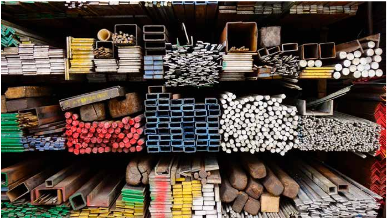
სახელმწიფო აუდიტის სამსახურის დასკვნა

„სააგენტოს 2020, 2021 და 2022 წლების პროგრამულ ბიუჯეტებში მითითებული აქვს საქმიანობის საბოლოო შეფასების ინდიკატორები, თუმცა ზოგადი ხასიათის გამო, ეს არ წარმოადგენს საზედამხედველო საქმიანობის შედეგების შეფასების გაზომვად ინდიკატორებს. საქმიანობის შეფასების კონკრეტული ინდიკატორების გარეშე, სააგენტო ვერ უზრუნველყოფს განხორციელებული საქმიანობის ობიექტურ შეფასებას და საკუთარი საქმიანობის ეფექტიანობის გაზომვას, რამაც შესაძლოა, გამოიწვიოს დაგეგმილი აქტივობების განხორციელების მიმართ ანგარიშვალდებულების შემცირება, ასევე სამომავლო აქტივობებზე რესურსების არაეფექტიანი განაწილება და პრიორიტეტების არასწორი განსაზღვრა“, – ვკითხულობთ აუდიტის დასკვნაში.