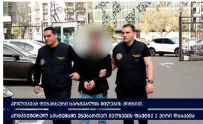
პოლიციამ ფინანსური სარგებლის მიღების მიზნით, კომპიუტერულ სისტემაში უნებართვო შეღწევის ფაქტზე 2 პირი დააკავა