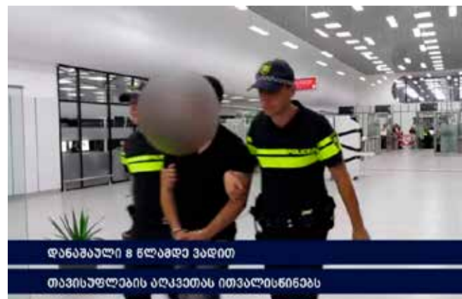
დანაშაული 8 წლამდე ვადით

გამოძიება სისხლის სამართლის კოდექსის 19-344-ე, 344-ე, 24-344-ე პრიმა და 362-ე მუხლებით მიმდინარეობს.