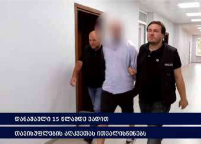
დანაშაული 15 წლამდე ვადით