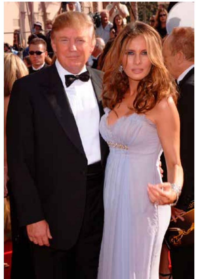
დასასრული მე-15 გვერდზე

ასევე, სკანდალური იყო 2018 წელს, პორნო-ვარსკვლავის, სტორმი დენიელსის განცხადებებიც. მისი თქმით, 2016 წლის არჩევნებამდე რამდენიმე კვირით ადრე, დონალდ ტრამპის ადვოკატმა მას 130 ათასი დოლარი გადაუხადა, რომ გაჩუმებულიყო და ტრამპთან ძველი ურთიერთობის შესახებ არაფერი ეთქვა. დენიელსის განმარტებით, მის ოჯახს ემუქრებოდნენ, ამიტომ დუმილი არჩია.