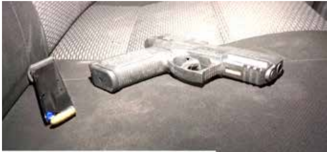
პოლიციამ დანაშაულის ჩადენის იარაღი ცეცხლსასროლი იარაღი ნივთმტკიცებად ამოიღო

შინაგან საქმეთა სამინისტროს კახეთის პოლიციის დეპარტამენტის თანამშრომლებმა, განსაკუთრებულ დავალებათა დეპარტამენტის თანამშრომლებთან ერთად ჩატარებული ოპერატიულ-სამძებრო ღონისძიებებისა და საგამოძიებო მოქმედებების შედეგად, ოჯახის წევრის მიმართ დამამძიმებელ გარემოებაში ჩადენილი განზრახ მკვლელობისა და იარაღის უკანონო ტარების ფაქტებზე, 1996 წელს დაბადებული, ძებნილი, ა.ს. დააკავეს.